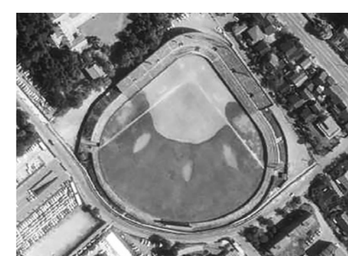
石川県営兼六園野球場(1973年撮影)