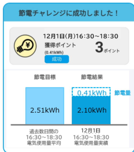
ほくリンクアプリ 画面イメージ