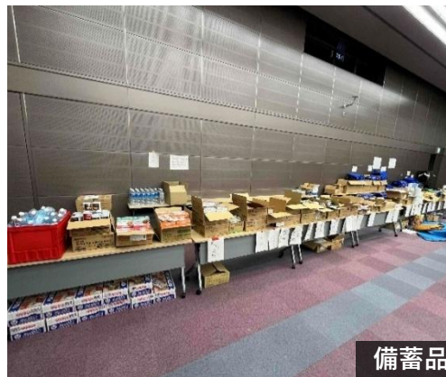
備蓄品等の物資（本店ビル）