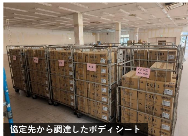
協定先から調達したボディシート