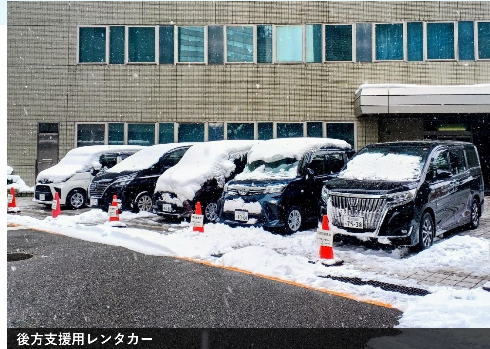
後方支援用レンタカー