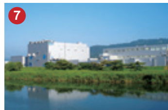
7 日本ゼオン ZEON (株)オプテス高岡工場 開発機能と生産機能が一体となった液晶用光学フィルム製造工場(高岡市)