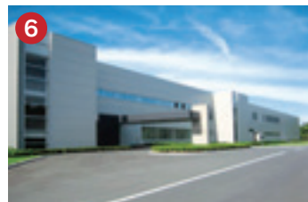
6 サンケン電気 SANKEN サンケンオプトプロダクツ(株) LED照明灯具、UPS(無停電電源装置)の生産工場(志賀町)