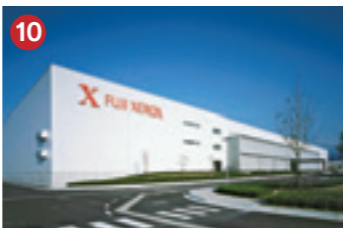
10 富士ゼロックス FUJI XEROX 富士ゼロックスマニュファクチャリング(株)富山事業所 カートリッジ成形から充てんまでの一貫生産を可能にした乳重合トナー製造工場(滑川市)