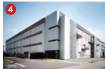
4 ジャパンディスプレイ JDI (株)ジャパンディスプレイ 石川工場 最先端の技術を駆使した中小型液晶パネル製造工場(川北町)