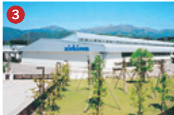
3 ニチコン NICHICON ニチコン製箔(株) 富田工場 大野市に進出したアルミニウム電解コンデンサ用電極箔製造工場(大野市)