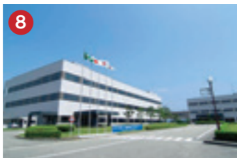
8 日立国際電気 Hitachi Kokusai Electric (株)日立国際電気 富山工場 八尾中核工業団地に進出した半導体製造装置の生産拠点(富山市八尾町)