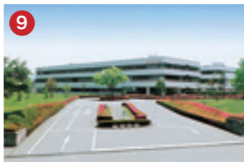
9 富士通 FUJITSU (株)富山富士通 八尾中核工業団地に進出したソフトウェア開発拠点(富山市八尾町)