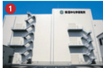
1 (株)田中化学研究所 Tanaka Chemical Corporation 原材料確保の利便性を求め、繊維産地に進出した電池電極材製造工場 (テクノポート福井/福井市)

国内有数のグループ企業や、外資系企業も進出を果たしており、北陸の魅力的な環境は、国内はもちろん海外からも高い評価を集めています。