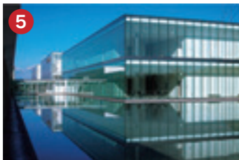
5 横河電機 YOKOGAWA 横河電機(株)金沢事業所 金沢テクノパークに進出したライフサイエンス事業の研究・開発・製造拠点(金沢市)