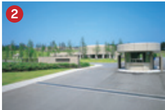
2 小野薬品工業(株) ONO PHARMACEUTICAL テクノポート福井に進出した医薬品研究所 (テクノポート福井/坂井市三国町)