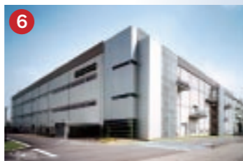
6 東芝モバイルディスプレイ 東芝モバイルディスプレイ(株)石川工場 最先端の技術を駆使した中小型液晶パネル製造工場(川北町)