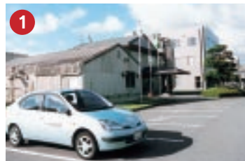
1 (株)田中化学研究所 Tanaka Chemical Corporation 原材料確保の利便性を求め、繊維産地に進出した電池電極材製造工場(テクノポート福井/福井市)

国内有数のグループ企業や、外資系企業も進出を果たしており、北陸の魅力的な環境は、国内はもちろん海外からも高い評価を集めています。