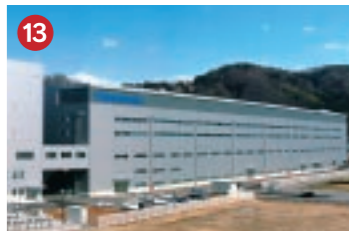
13 パナソニック Panasonic パナソニック(株)セミコンダクター社 魚津工場 世界最先端の加工技術を導入したシステムLSI量産拠点(魚津市)