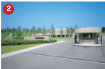
2 小野薬品工業(株) ONO PHARMACEUTICAL テクノポート福井に進出した医薬品研究所(テクノポート福井/坂井市三国町)