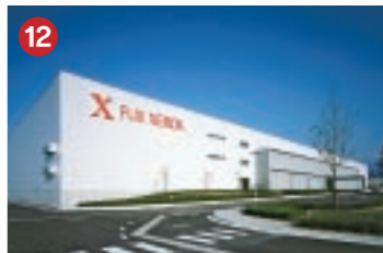
12 富士ゼロックス FUJI XEROX 富士ゼロックスマニュファクチャリング(株)富山事業所 カートリッジ成形から充てんまでの一貫生産を可能にした乳化重合トナー製造工場(滑川市)