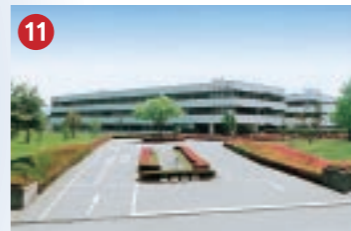
11 富士通 FUJITSU (株)富山富士通 八尾中核工業団地に進出したソフトウェア開発拠点(富山市八尾町)