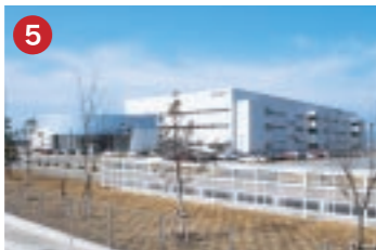
5 ソニー SONY ソニーケミカル&インフォメーションデバイス(株)根上事業所 携帯電話・デジタル家電などの小型化・高性能化を支えるプリント基板製造工場(能美市)