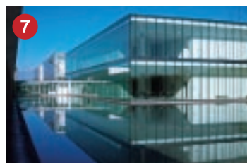
7 横河電機 YOKOGAWA 横河電機(株)金沢事業所 金沢テクノパークに進出したライフサイエンス事業の研究・開発・製造拠点(金沢市)