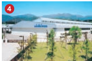
4 ニチコン NICHICON ニチコン(株)富田工場 大野市に進出したアルミニウム電解コンデンサ用電極箔製造工場(大野市)