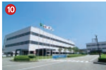
10 日立国際電気 Hitachi Kokusai Electric (株)日立国際電気 富山工場 八尾中核工業団地に進出した半導体製造装置の生産拠点(富山市八尾町)