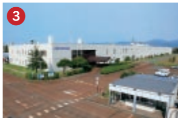
3 ルネサス関西セミコンダクタ RENESAS ルネサス関西セミコンダクタ(株)福井工場 高度情報化社会を支える世界No.1のクオリティを目指す電子部品工場(坂井市春江町)