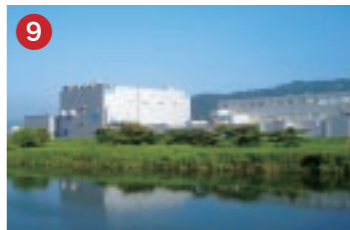
9 日本ゼオン ZEON (株)オプテス高岡工場 開発機能と生産機能が一体となった液晶用光学フィルム製造工場(高岡市)