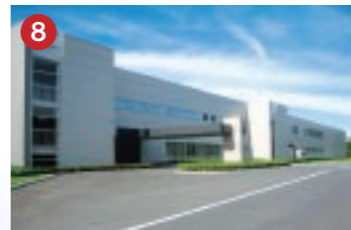
8 サンケン電気 SANKEN サンケンオプトプロダクツ(株) 液晶バックライト用冷陰極蛍光管の世界最大規模の製造工場(志賀町)