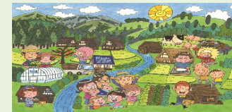
新たな暮らし方の提案