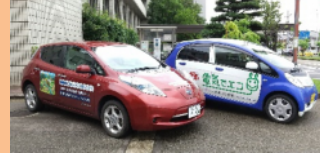
南砺市・北陸電力・北陸電力送配電が保有するEVの利活用