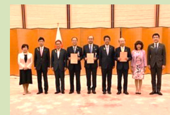
SDGs 未来都市 選定証授与式 〔令和元年7月〕 於 首相官邸