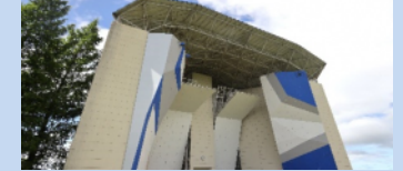
桜ヶ池クライミングセンターの利活用（北陸電気工事） [2020/7 リニューアル]