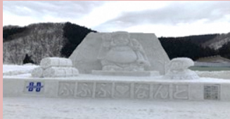
南砺利賀そばまつりでの雪像づくり