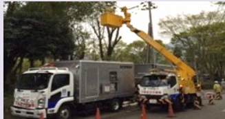
災害時の復旧作業