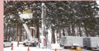
とやま・なんと国体2020での電力供給確保（電源車の配備）