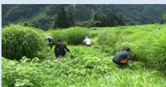
相倉合掌集落の茅場下草刈り