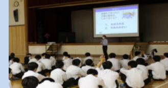
学校へのお出前講座