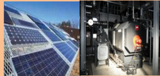
太陽光・バイオマス熱等の再エネ活用