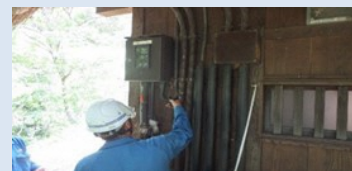
菅沼・相倉合掌集落の電気設備点検