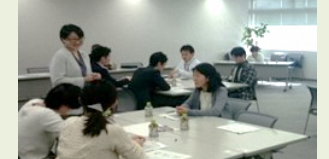
各種セミナー開催